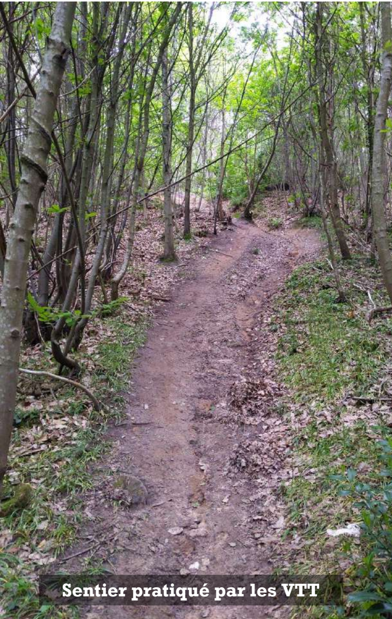
Sentier pratiqué par les VTT