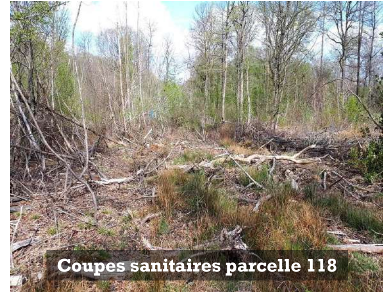
Coupes sanitaires parcelle 118