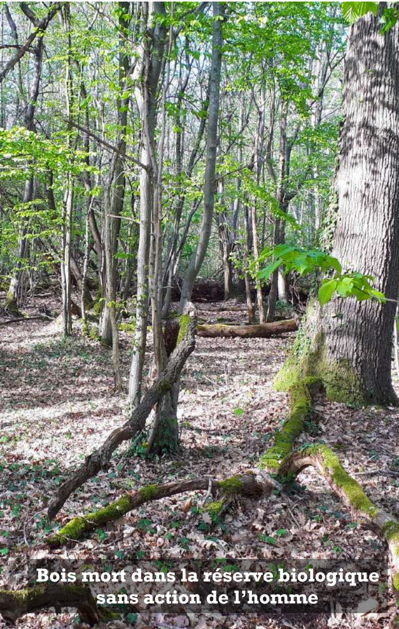
Bois mort dans la réserve biologique sans action de l'homme