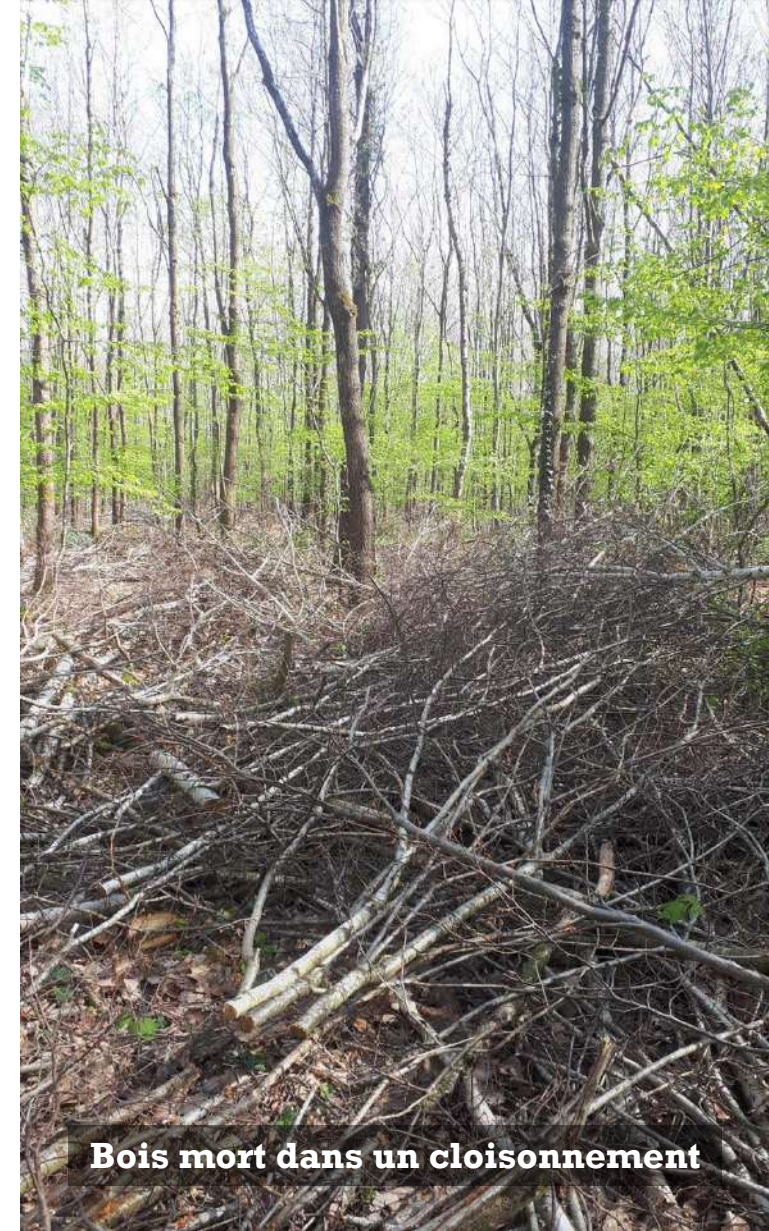
Bois mort dans un cloisonnement