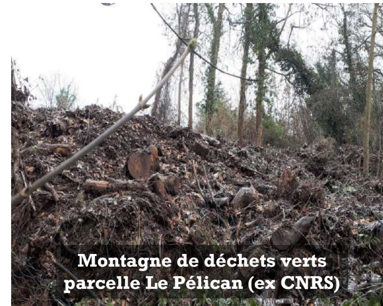
Montagne de déchets verts parcelle Le Pélican (ex CNRS)