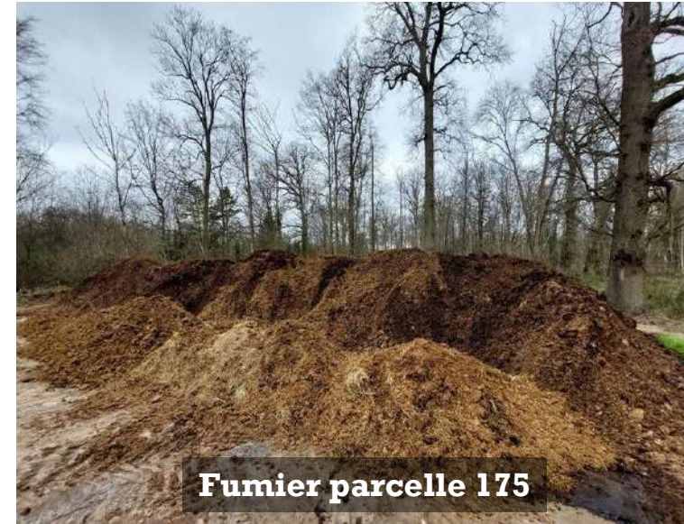
Fumier parcelle 175

Conformément à l'Art.155 du RSD, les dépôts de fumier ne doivent pas entraîner une pollution des ressources d'eau. www.hauts-de-france.ars.sante.fr/sites/default/files/2017-02/RSD_59.pdf